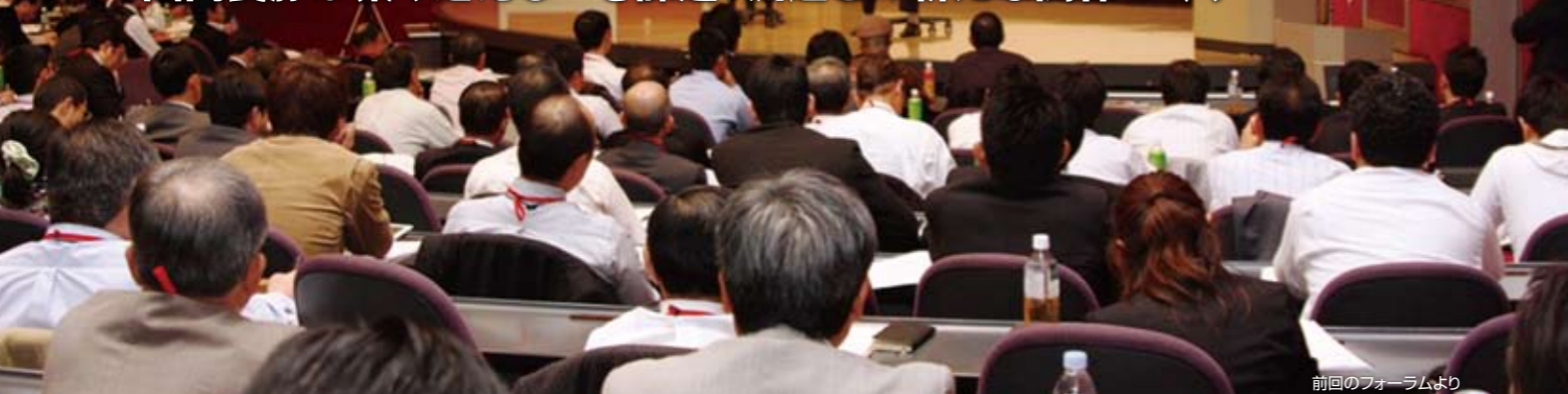
前回のフォーラムより